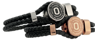
ORGANO Vital Armband